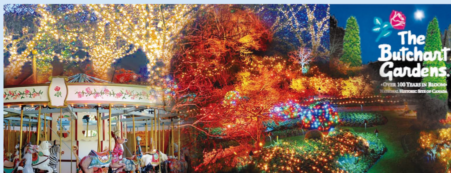
聖誕節期間夜遊寶翠花園一年一度的 " Magic of Christmas " 觀賞聖誕燈飾 （* 只適用於 12 月 1 日 ~ 1 月 6 日期間的行程，集合時間將延後 2 小時）